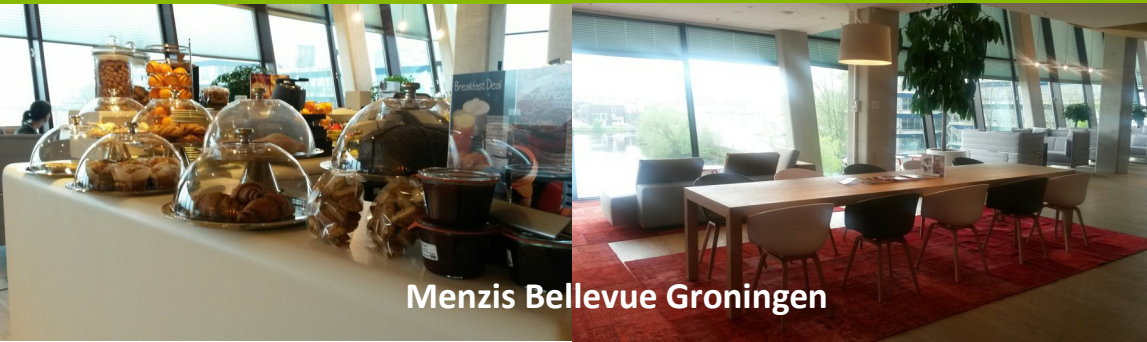
Menzis Bellevue Groningen